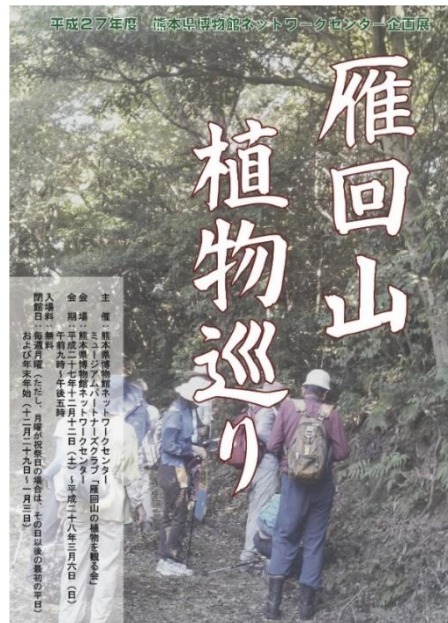
図1. 熊本県博物館ネットワークセンターと雁回山の植物を見る会の共催で開催した企画展「雁回山植物巡り」の広報チラシ(表)。

本報告は、「くまもと自然と文化の学芸員」養成講座とその後の雁回山の植物を観る会の活動、およびそれに付随した当センター職員による収集標本に基づいた雁回山の植物の一覧を供すると共に、それらを過去の情報と比較した結果を報告する。