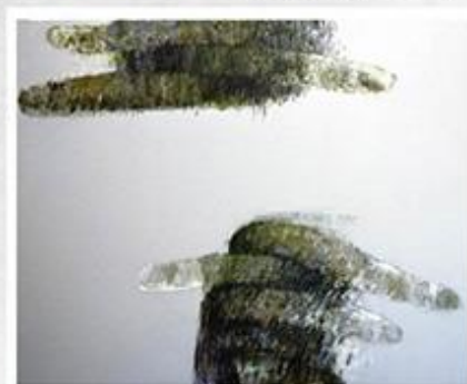
森本猛《風に託した思い》