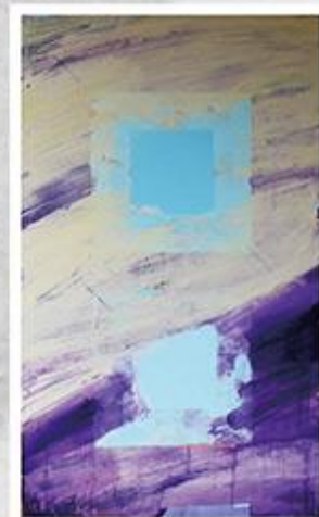
内田勝弘《容(かたち)》