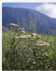
アソノコギリソウ