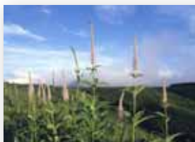
ツクシクガイソウ