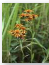
タカネコウリンギク