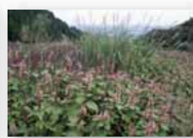
オオマルバノテンニンソウ