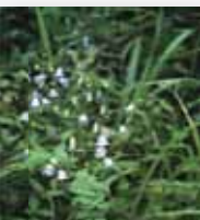
マンシュウツリ ガネニンジン